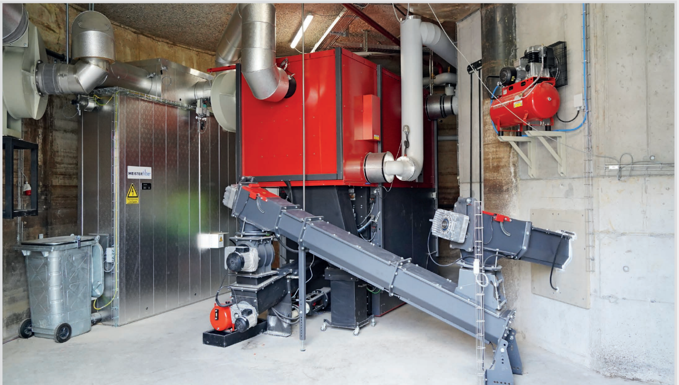
Raumaustragung mit Verbindungsschnecke auf die Zelleradschleuse.