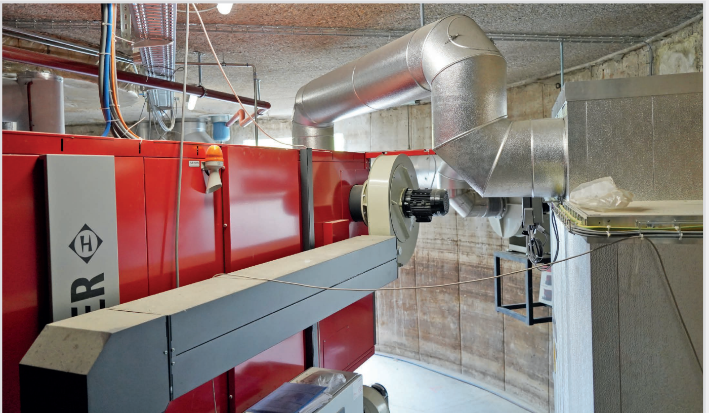
Die Rauchgas-Rezirkulation mit Ventilator reduziert die Temperatur im Brennraum und verringert dadurch den Verschleiss von Rost und Schamottierung.